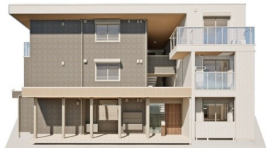
※完成予想図につき、実物とは多少異なる場合があります。